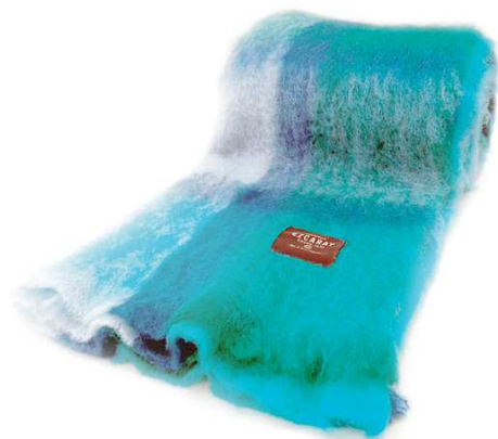
No.960-b Mohair check ブランケット 青