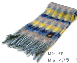
MI-16F Mia マフラー 黄