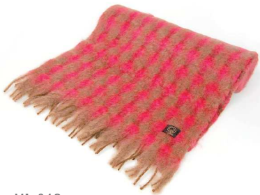
MI-04S Mia ストール 赤茶