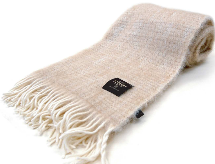
D-16 Diana ブランケット ベージュ

毛 50%、モヘヤ 50% サイズ:約130×180cm(フリンジは含みません) 本体価格 ¥29,000 +税