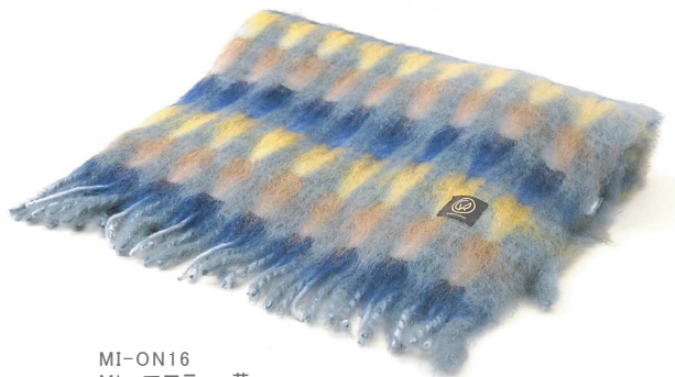
MI-ON16 Mia マフラー 黄

毛 60%、モヘヤ 40% サイズ:約65×100cm (フリンジは含みません) 本体価格 ¥12,000 +税