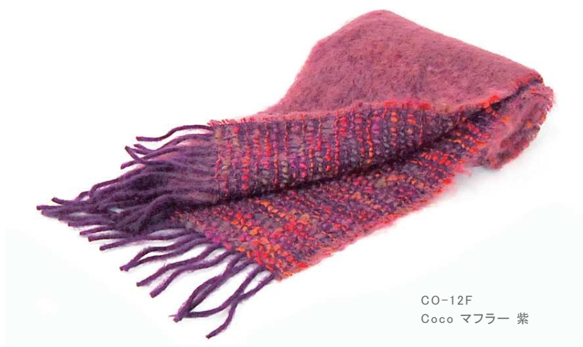
CO-12F Coco マフラー 紫

毛 60%、モヘヤ 40% サイズ:約22×170cm (フリンジは含みません) 本体価格 ¥9,300 +税