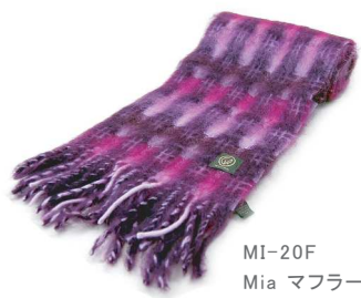
MI-20F Mia マフラー 紫