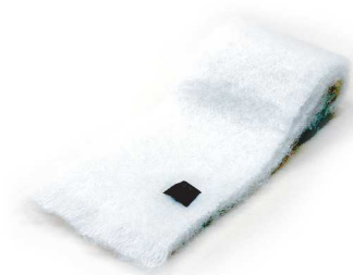
CM-001F Mohair マフラー 白