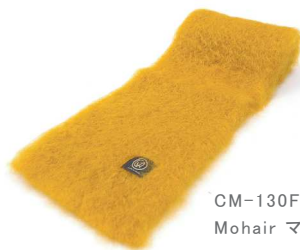
CM-130F Mohair マフラー 黄