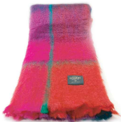
No.957 Mohair check ブランケット 赤