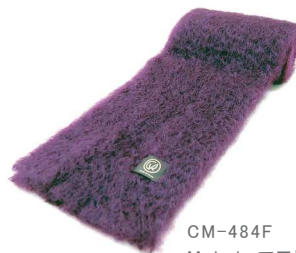
CM-484F Mohair マフラー 紫