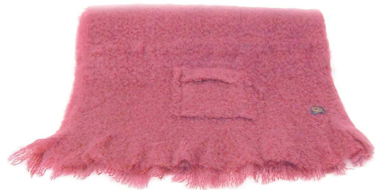
CM-753SP Mohair ストール 赤紫