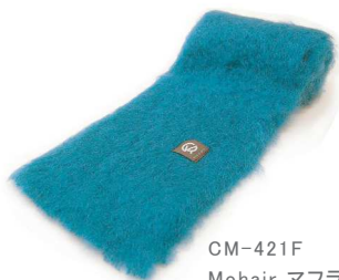
CM-421F Mohair マフラー 青