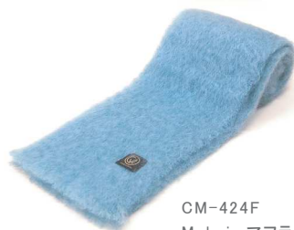
CM-424F Mohair マフラー 水色