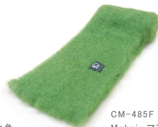
CM-485F Mohair マフラー 黄緑