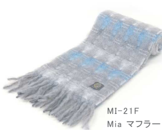
MI-21F Mia マフラー 青グレー