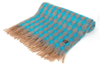
MI-07S Mia ストール 青茶