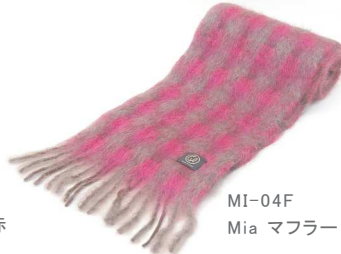
MI-04F Mia マフラー 赤茶