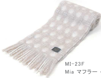
MI-23F Mia マフラー ベージュ