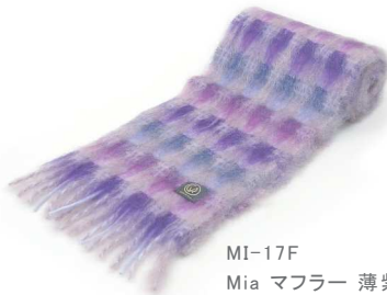
MI-17F Mia マフラー 薄紫