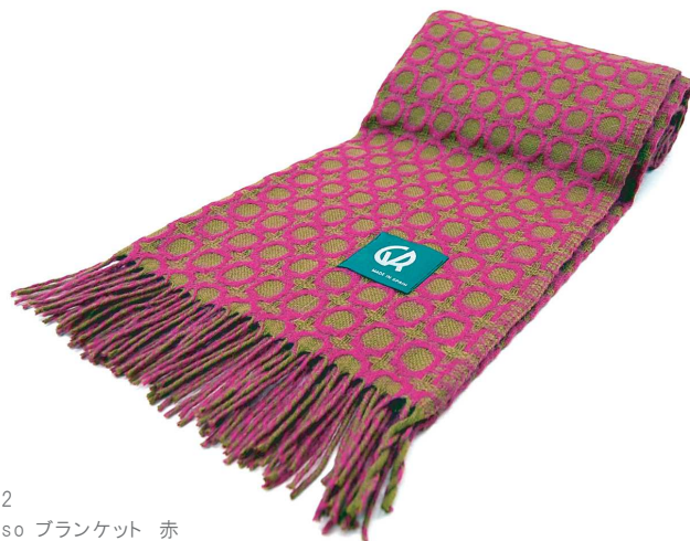
PS-12 Picasso ブランケット 赤