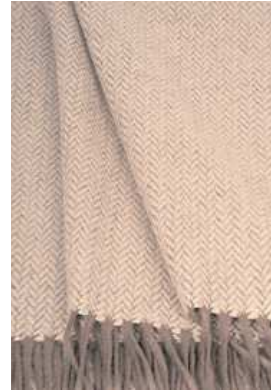
E-02 Australia ブランケット ベージュ