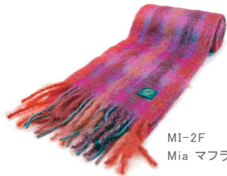
MI-2F Mia マフラー 赤

毛 60%、モヘヤ 40% サイズ:約22×170cm (フリンジは含みません) 本体価格 ¥8,300 +税