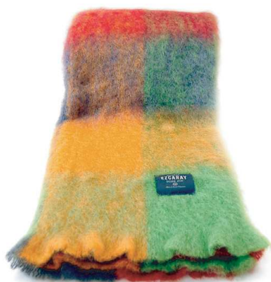
No.3033 Mohair check ブランケット カラー