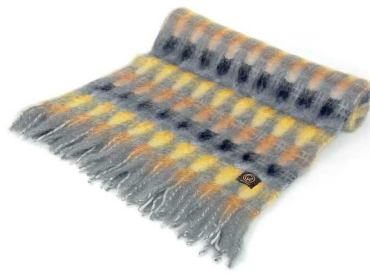
MI-16S Mia ストール 黄