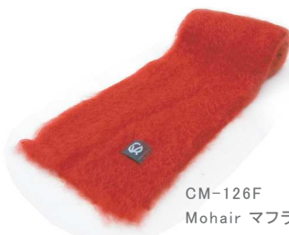
CM-126F Mohair マフラー 赤