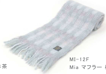
MI-12F Mia マフラー 桜緑