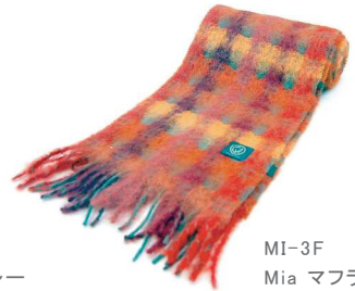
MI-3F Mia マフラー オレンジ