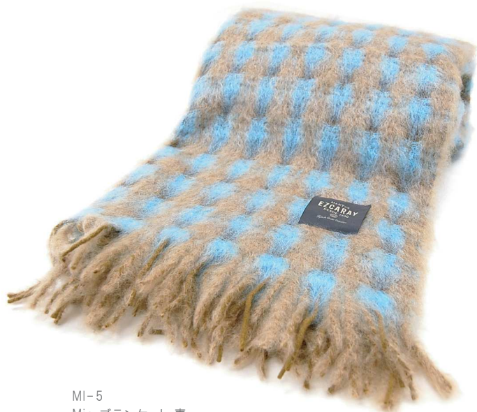
MI-5 Mia ブランケット 青

毛 60%、モヘヤ 40% サイズ:約130×190cm(フリンジは含みません) 本体価格 ¥29,000 +税