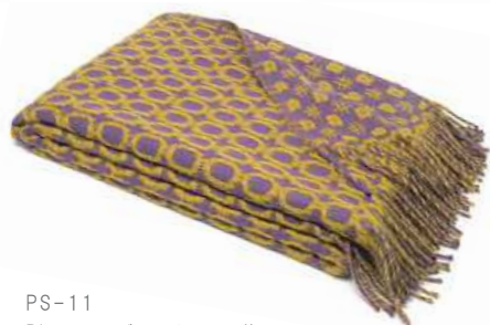
PS-11 Picasso ブランケット 紫