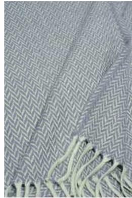
E-27 Australia ブランケット 緑