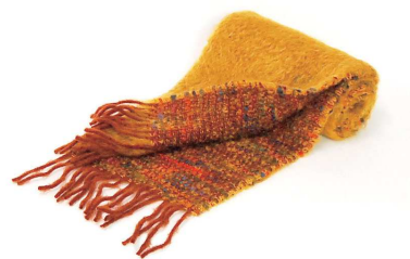
CO-10F Coco マフラー 黄