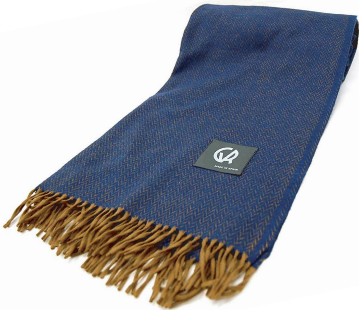
E-17 Australia ブランケット 紺

毛 100% サイズ:約130×200cm(フリンジは含みません) 本体価格 ¥29,000 +税