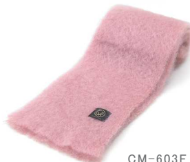
CM-603F Mohair マフラー ピンク