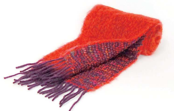
CO-14F Coco マフラー 赤