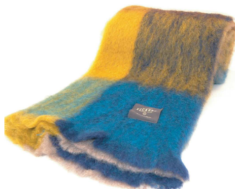
No.964 Mohair check ブランケット 黄