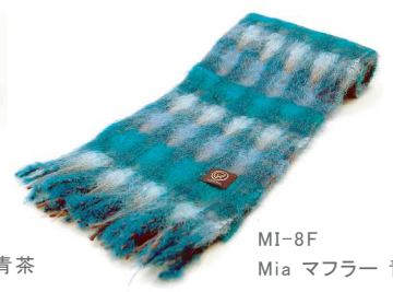
MI-8F Mia マフラー 青