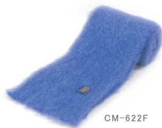
CM-622F Mohair マフラー 藤色