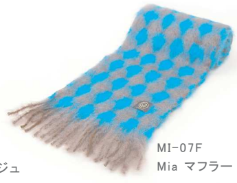
MI-07F Mia マフラー 青茶