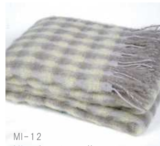
MI-12 Mia ブランケット 黄