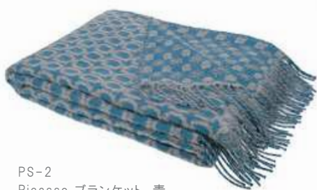
PS-2 Picasso ブランケット 青