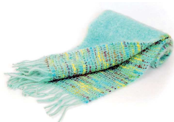
CO-02F Coco マフラー エメラルドグリーン