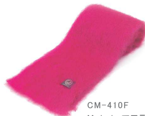
CM-410F Mohair マフラー マゼンタ