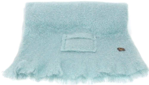
CM-424SP Mohair ストール 水色

モヘヤ 66%、毛 34% サイズ:約45×200cm (フリンジは含みません) 本体価格 ¥19,000 +税