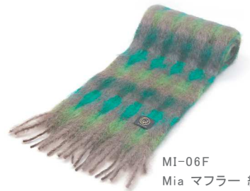
MI-06F Mia マフラー 緑茶