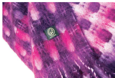
MI-ON20 Mia マフラー 紫