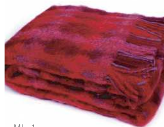
MI-1 Mia ブランケット 赤