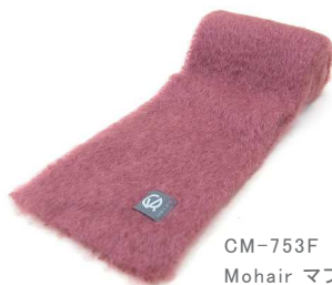
CM-753F Mohair マフラー 赤紫