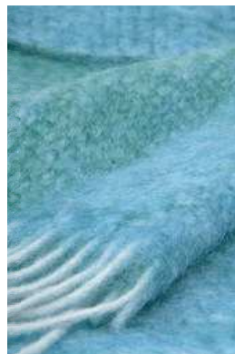
D-6 Diana ブランケット 青