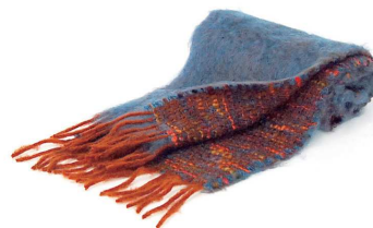
CO-08F Coco マフラー 青