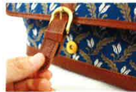
ベルト部分の開閉はマグネット