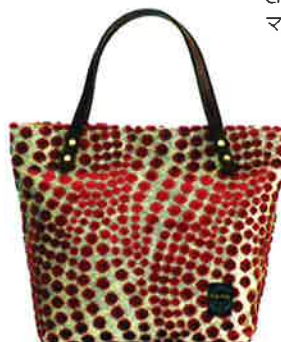
CBR-002 PR ボリス・ピンクレッド