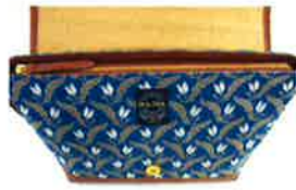
フタの下にファスナー開閉