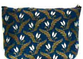
CFD-117 BL ファランドール・ブルー