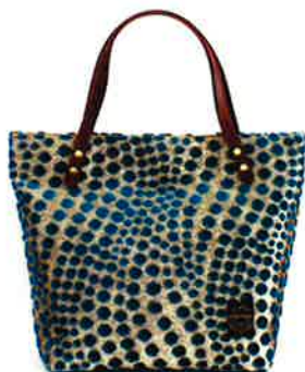
CBR-002 BG ボリス・ブルーグリーン