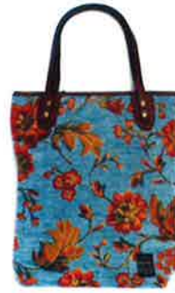
CST 038BL サンティーニ・ブルー