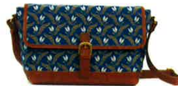
CFD-003 BL ファランドール・ブルー