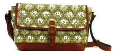
CLP-003 BE ルピン・ベージュ