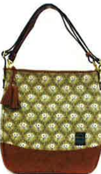
CLP-004 BE ルピン・ベージュ