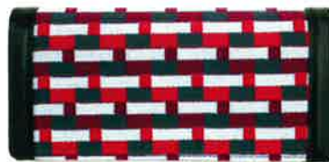
CBZ-450 PI バス・ピンク

↑ 開閉のスナップボタンは上下に 2 個付いているので、厚みが増しても安心です。