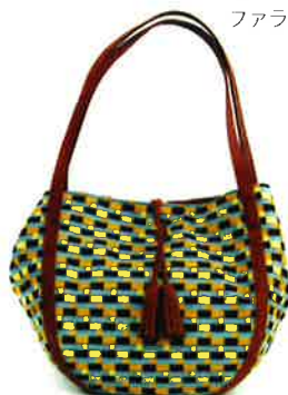
CBZ-001 YB バス・イエロー × ブルー