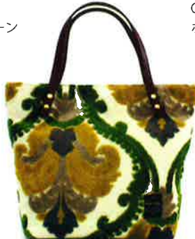
CVT-002 YG ビルトゥーツ・イエロー × グリーン