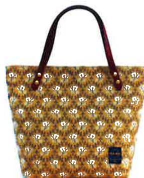
CLP-002 BE ルピン・ベージュ