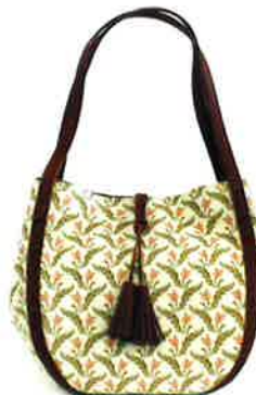
CFD-001 PI ファランドール・ピンク