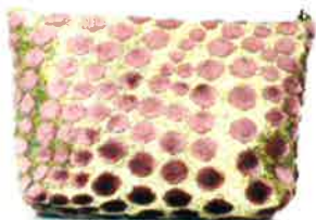
CBR-117 VI ボリス・ヴァイオレット