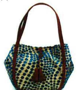
CBR-001 BG ボリス・ブルーグリーン