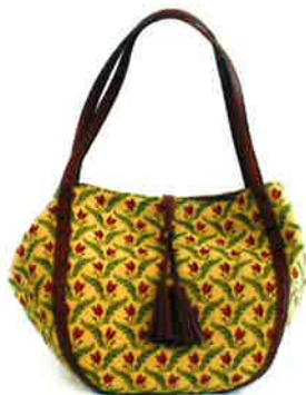
CFD-001 RD ファランドール・レッド