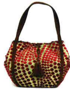
CBR-001 PR ボリス・ピンクレッド