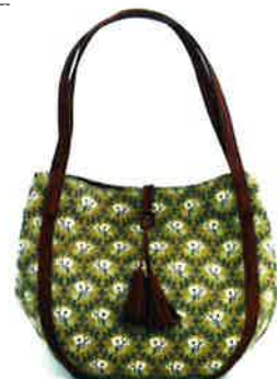
CLP-001 BE ルピン・ベージュ