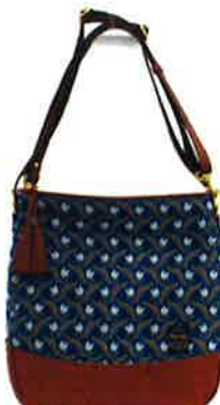
CFD-004 BL ファランドール・ブルー