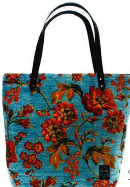
CST-019BL サンティーニ・ブルー