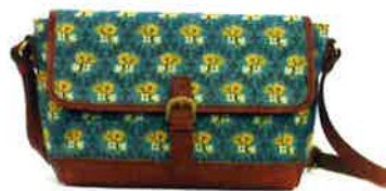
CLP-003 BL ルピン・ブルー