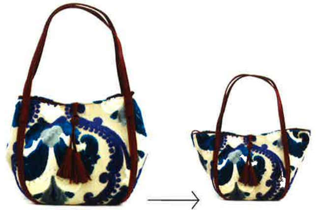
CVT 001 BL ビルトゥーン・ブルー