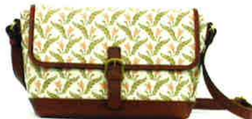
CFD-003 PI ファランドール・ピンク