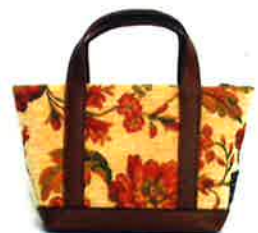
CST-044BE サンティーニ・ベージュ