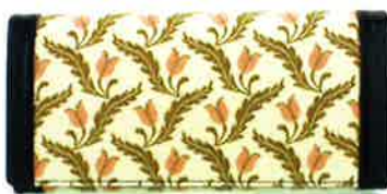
CFD-450 PI ファランドール・ピンク