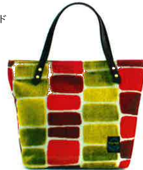
CM-002 PG マイアミ・ピンク × グリーン