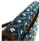
出し入れ便利な外ポケット