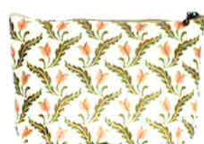
CFD-117 PI ファランドール・ピンク