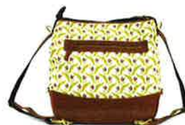
裏側にファスナーの外ポケット