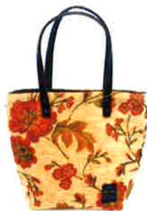
CST-013BE サンティーニ・ベージュ