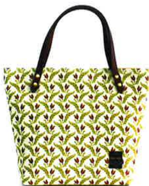
CFD-002 WI ファランドール・ワイン