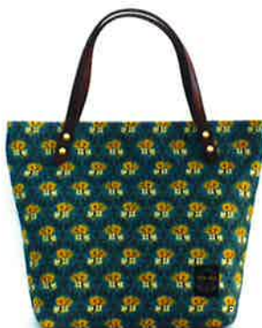
CLP-002 BL ルピン・ブルー