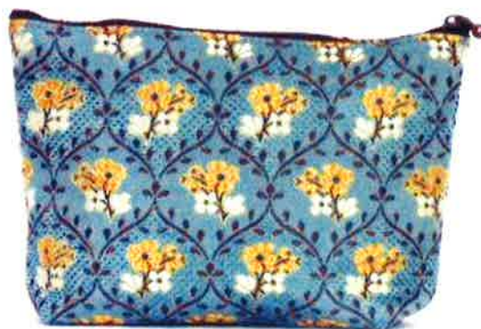
CLP-117 BL ルピン・ブルー