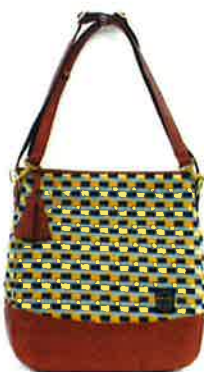
CBZ-004 YB バス・イエロー×ブルー