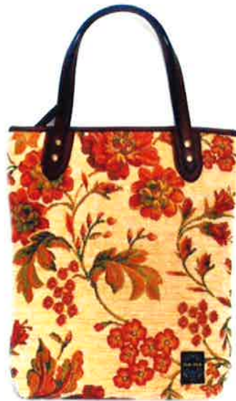
CST 038BE サンティーニ・ベージュ