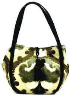
CVT-001 BK ビルトゥーン・ブラック