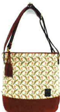
CFD-004 PI ファランドール・ピンク