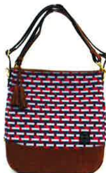
CBZ-004 PI バス・ピンク