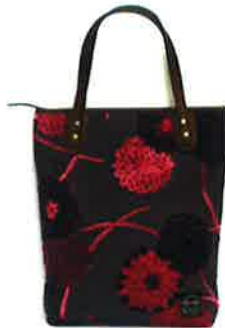
CZA 038RD ジニア・レッド