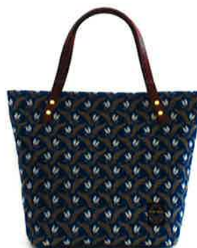
CFD-002 BL ファランドール・ブルー