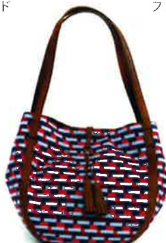
CBZ-001 PI バス・ピンク