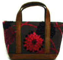
CZA 044RD ジニア・レッド