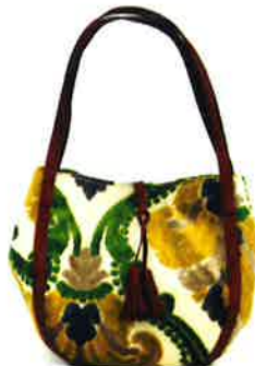
CVT-001 YG ビルトゥーン・イエロー × グリーン