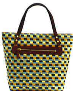
裏面に外ポケット付