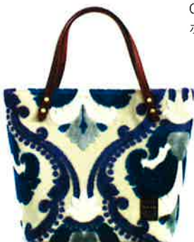
CVT-002 BL ビルトゥーツ・ブルー