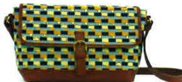
CBZ-003 YB バズ・イエロー×ブルー