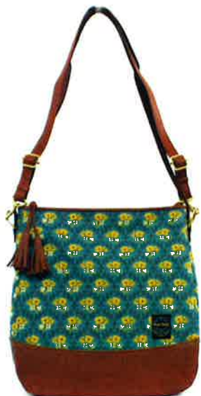
CLP-004 BL ルピン・ブルー