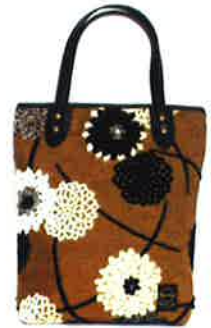
CZA 038WB ジニア・白黒