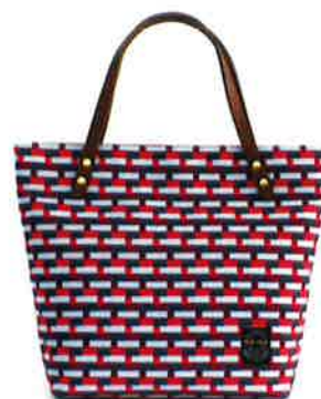
CBZ-002 PI バス・ピンク