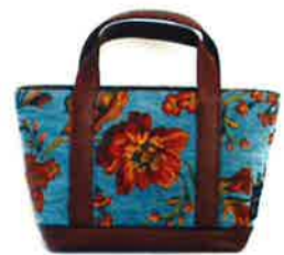
CST-044BL サンティーニ・ブルー