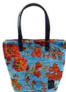
CST-013BL サンティーニ・ブルー