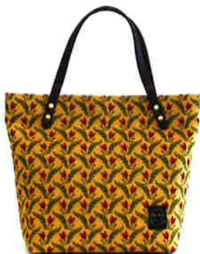
CFD-002 RD ファランドール・レッド