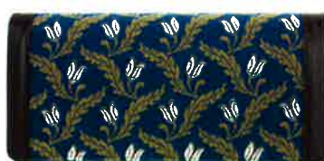
CFD-450 BL ファランドール・ブルー