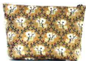
CLP-117 BE ルピン・ベージュ