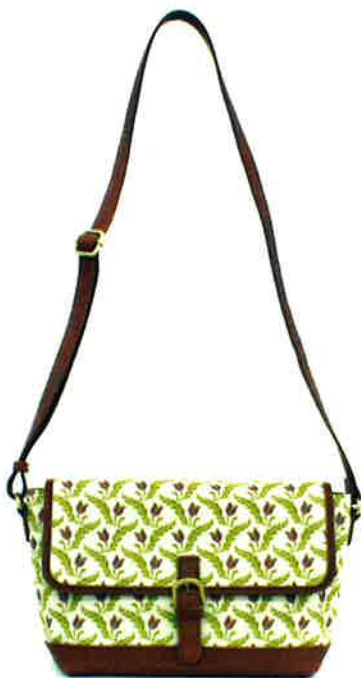
CFD-003 WI ファランドール・ワイン