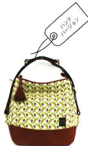
CFD-004 WI ファランドール・ワイン