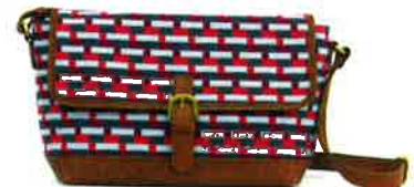
CBZ-003 PI バズ・ピンク