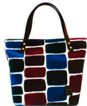
CMI-002 BP マイアミ・ブルー × パープル