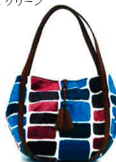
CMI-001 BP マイアミ・ブルー × パープル