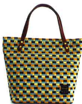
CBZ-002 YB バス・イエロー × ブルー