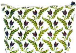
CFD-117 WI ファランドール・ワイン