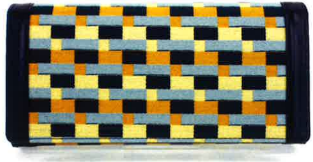
CBZ-450 YB バス・イエロー × ブルー