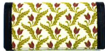
CFD-450 WI ファランドール・ワイン