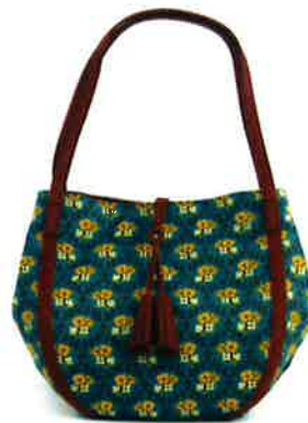
CLP-001 BL ルピン・ブルー