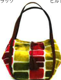
CMI-001 PG マイアミ・ピンク × グリーン