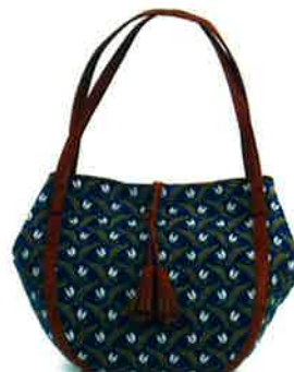
CFD-001 BL ファランドール・ブルー