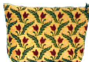
CFD-117 RD ファランドール・レッド