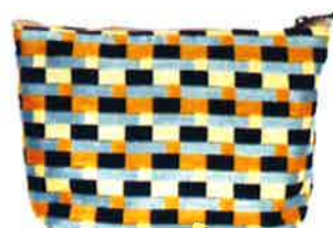
CBZ-117 YB バズ・イエロー × ブルー